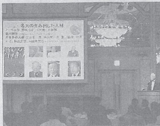
経営者ら約200人が出席した